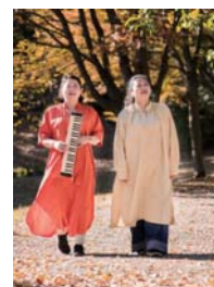
ほづみ 《鍵盤ハーモニカと歌》