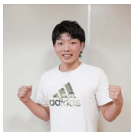
Sports Lab ATHLEO 《ボクシング》