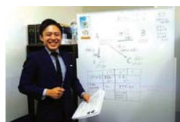
あいりん司法書士・ 行政書士事務所 《終活・遺言・相続》