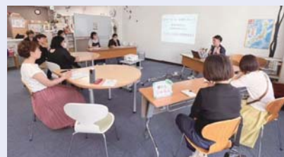
阿部先生の 講座の様子

繋がることで私が救われたように、今一人で辛さを抱えている人とも繋がりたい。当事者が理解と共感を得られる、安心できる居場所として“にしとも広場”でお待ちしています。