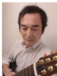
コーケンボー 《ジャズ・ポップス》