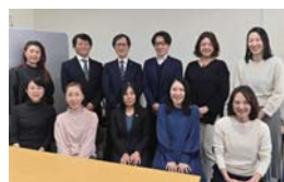
ソワレ行政書士法人 《終活・遺言・相続》