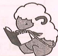
読書活動推進プロジェクト マスコット「シーボン」