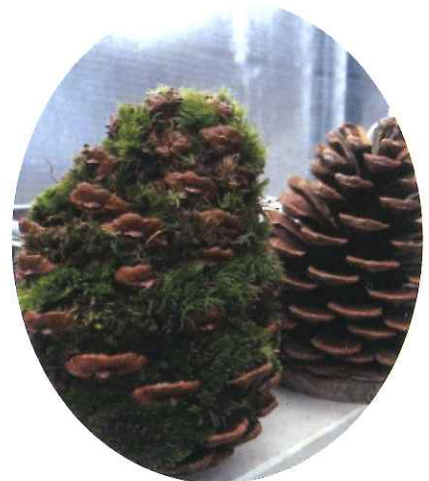
松ぼっくりの苔玉

JR 京浜東北・根岸線「磯子駅」徒歩4分 改札を出て右側直結歩道橋を渡ってください。駐車場はありません。