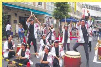
鶴見総合高校和太鼓部がゲスト出演!