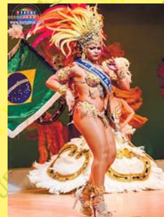
本場ブラジルのプロダンサー