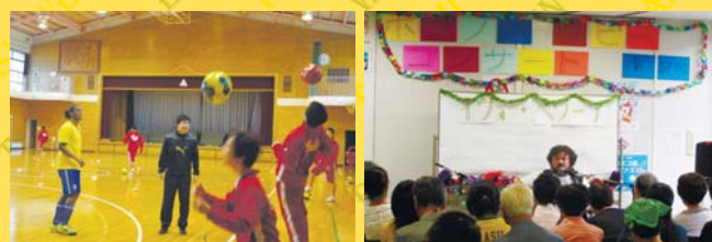
本場仕込のサッカーワークショップ 大盛況のロビーコンサート

■募集 ①20人 ②15人 ③15人 ④60人 ■費用 ①無料 ②500円 ③800円 ④無料 ■申込 ①,②,③ 9/24～先着順(来館) 電話受付は翌日25日より ④申込不要(先着順) ■問合せ 駒岡地区センター ☎045-571-0035